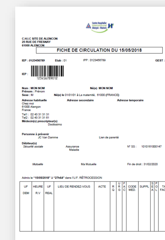
Fiche de circulation*

* Fiche à récupérer à la « régie des recettes » située dans le hall d'accueil de l'hôpital (porte en verre)