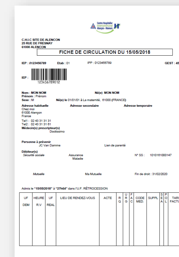
Fiche de circulation*

* Fiche à récupérer à la « régie des recettes » située dans le hall d'accueil de l'hôpital (porte en verre)